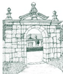
QUINTA DO ERVEDAL